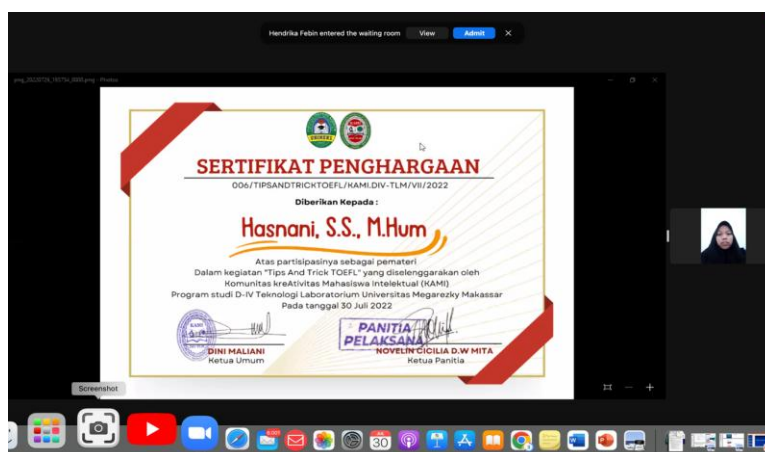
Gambar 3 : Penyerahan Sertifikat Penghargaan oleh Ketua KAMI