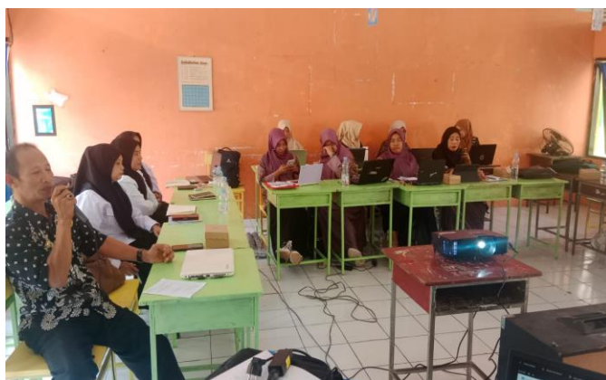
Gambar : Merancang pembelajaran yang berpusat pada murid melalui aksi nyata