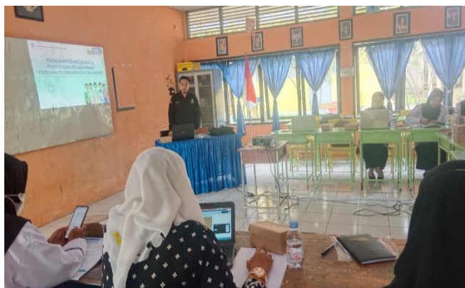
Gambar : Pemaparan materi terkait keberagaman anak didik

ekonomi, latar belakang keluarga. Adapun aktivitas pemaparan materi terkait keberagaman anak didik beserta kebutuhannya dapat dilihat pada gambar dibawah ini;