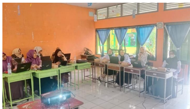
Gambar : Elaborasi pemahaman terkait pembelajaran dan ekosisten sekolah yang berpusat pada murid

Pembelajaran yang sesuai ekosisten di TK PKK Nur Amlyia Calio, guru merancang aktivitas belajar dan bermain yang berpusat pada Anak, perbanyak interaksi dengan anak dengan memancing anak untuk mengemukakan pendapatnya, memberikan support penuh pada anak dan memberikan perlakuan yang sama, menggunakan media ajar yang efektif dan tepat. Pembelajaran yang sesuai ekosisten di TK Aba Hubbul Watan Tanalle, masih sementara melakukan pembenahan dan terus belajar untuk bagaimana melakukan pembelajaran dan ekosistem yang sesuai kebutuhan dan berpusat pada peserta didik. Pembelajaran yang sesuai ekosisten di TK Semen Tonasa II, terkait kegiatan beragama kristen dan yang beragama Islam di pimpin bergantian oleh guru piket bulanan sekolah berdasarkan dengan hasil diskusi Komite dan pengurus Yayasan sekolah. Pembelajaran yang sesuai ekosisten di TK, diterapkan dengan melakukan pembelajaran yang sesuai dengan kebutuhan anak, tetapi kami juga masih tahap belajar mencermati segala pembelajaran yang sesuai dengan kebutuhan anak didik saya, dan bagaimana cara memberikan lingkungan belajar yang menarik bagi mereka. Adapaun aktivitas penilaian pembelajaran dan ekosisten sekolah yang berpusat pada murid dapat dilihat pada gambar di bawah ini;