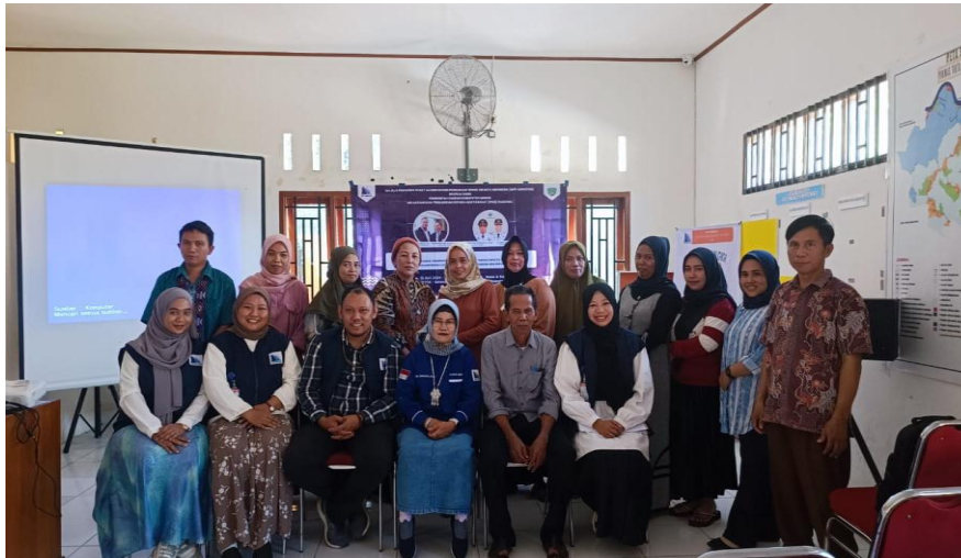
Gambar 1. Tim PkM Bersama Masyarakat Desa Bontoma'tene

Desa Bonto Mate'ne memiliki luas 4,67 km 2 dan penduduk berjumlah 2.732 jiwa dengan tingkat kepadatan penduduk sebesar 585,01 jiwa/km 2 pada tahun 2021. Adapun rasio jenis kelamin penduduk Desa Bonto Mate'ne pada tahun tersebut adalah 96,97. Artinya, tiap 100 penduduk perempuan ada sebanyak 96 penduduk laki-laki. Masyarakat Desa Bonto Mate'ne mayoritas bermata pencaharian sebagai petani padi sawah dan pedagang. Adapun pekerjaan lainnya yang digeluti adalah buruh, nelayan, dan sopir (Statistik, 2010).