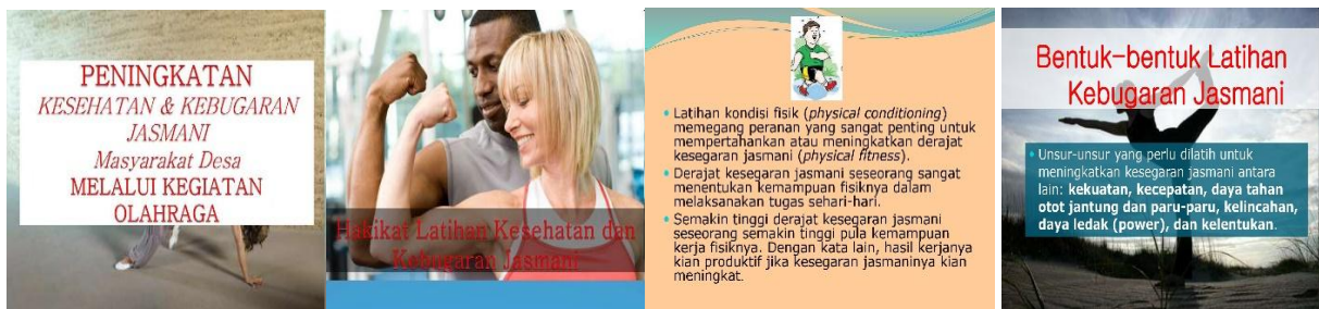
Gambar 3. Materi yang disampaikan Kepada Peserta PKM

Ketiga pertanyaan audiens dijawab oleh pemateri. Pertanyaan pertama dijawab dengan menampilkan gambar pada slide presentasi dan menjelaskan terkait jenis olahraga yang dapat dilakukan untuk menjadi sehat seperti berlari, berenang, mengangkat beban.