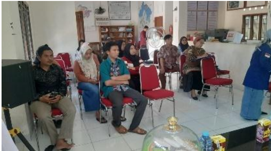
Gambar 5. Penyampaian Materi Oleh Pembicara/Pemateri dan sekaligus Menjawab Pertanyaan Masyarakat.

Adapun jawaban untuk pertanyaan kedua dijawab dengan menjelaskan waktu Yang baik untuk berolahraga yaitu pada pagi hari, dimana pada pagi hari dapat meningkatkan energi dan mood sepanjang hari, dapat membantu membentuk rutinitas yang konsisten, dan dapat meningkatkan metabolisme, pada pagi hari juga dimana suhu udara umumnya lebih sejuk, yang bisa lebih nyaman untuk berolahraga di luar ruangan. Namun, sbelum melakukan olahraga terlebih dahulu melakukan pemanasan agar otot tidak kaku. Siang hari juga bisa, untuk merilekskan diri dari pekerjaan atau aktivitas harian. Kemudian pada sore dan malam hari juga bisa, ini adalah cara yang baik untuk melepaskan stress setelah seharian berkerja. Waktu berolahraga bisa dilakukan bervariasi tergantung pada preferensi individu.