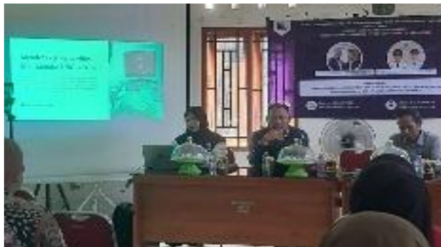
Gambar 3. Peserta PKM Masyarakat Desa Bontomatene